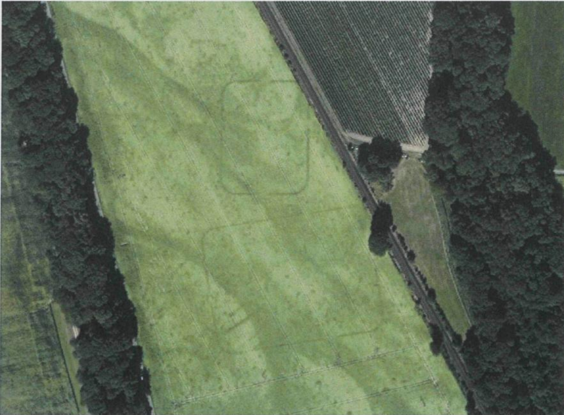
Abb. 1 Spuren römischer Übungslager im Luftbildbefund

Das nördlich anschließende Übungslager NGP 2013/0005 ist ebenfalls vollständig erfasst und umfasst ein Areal von ca. 83 x 63 m (Außenkante Lagergraben) und einer Gesamtfläche von 0,5 ha. Durch Luftbildbefunde sind alle vier Lagerecken dokumentiert, wodurch eine genaue Lagebestimmung ermöglicht wird.